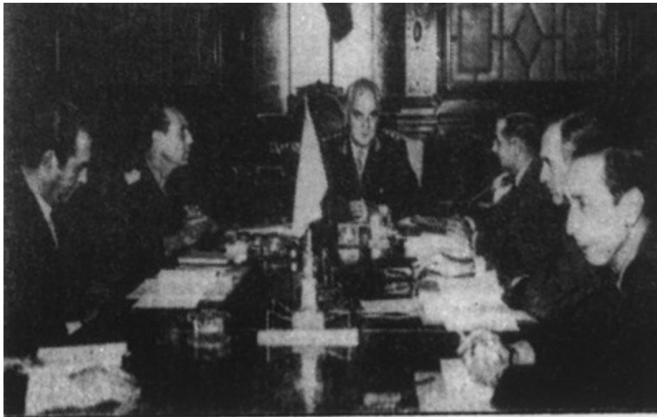
Reunión de asesinos, en esa u otra reunión se aprobó la masacre de Trelew

Alejandro Agustín Lanusse , presidente de la nación y jefe del ejército