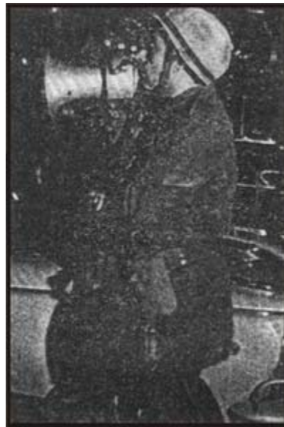
El asesino de Trelew dirigiéndose a los cros. en el aeropuerto