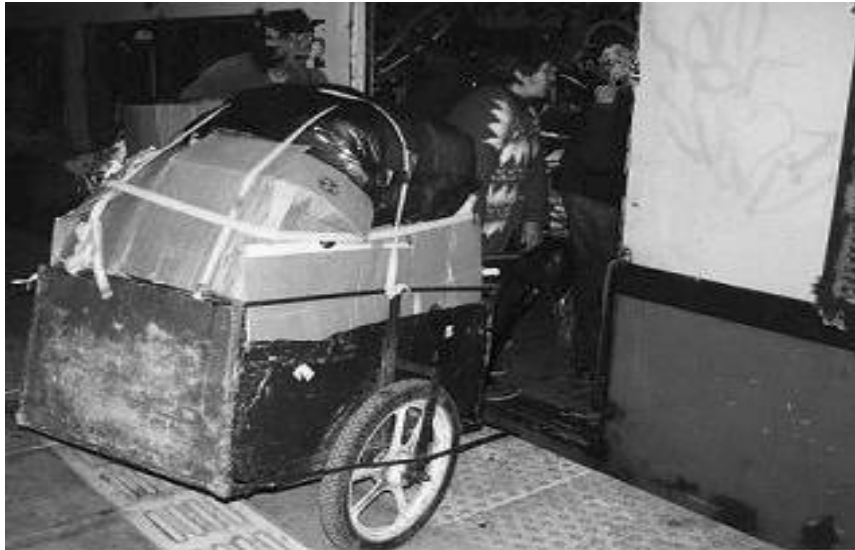
Exigimos más vagones

“...Así yo canto para recordar que aún seguimos vivos, si no ves más allá de tu horizonte estaremos perdidos.” Ya ves, I smael Serrano